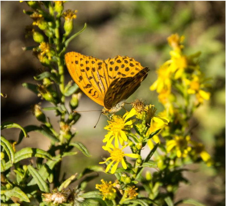
Keizersmantel op Jakobskruid als laatste groet uit de herfst in 2017