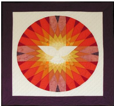
Protestantse Kerk Nederland