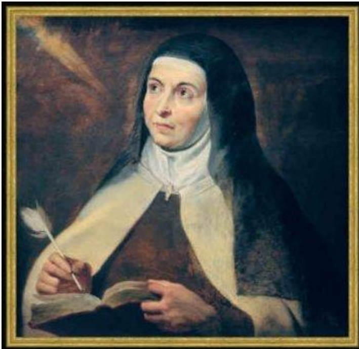
Schilderij geschilderd door Peter Paul Rubens